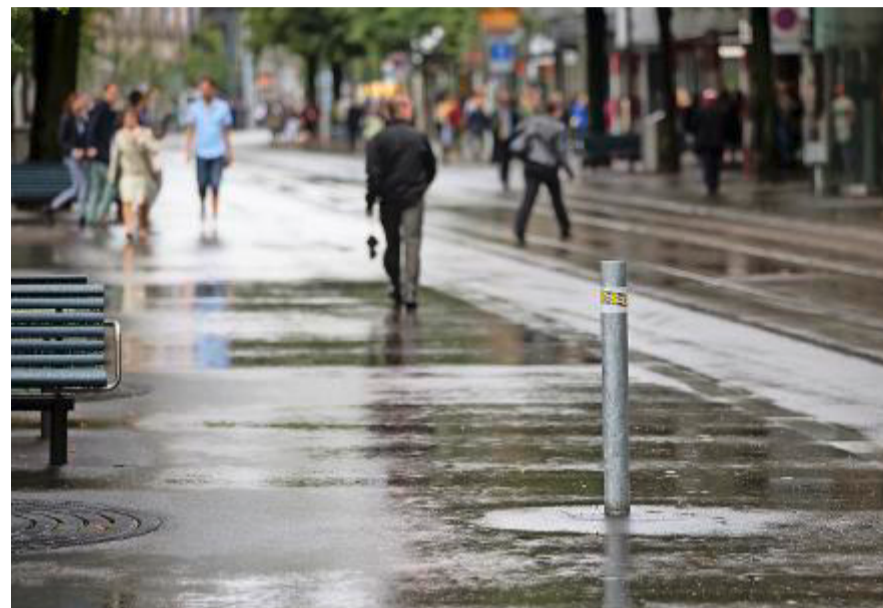
Pfosten 31 ist einem Unfall zum Opfer gefallen.

Wila - In der Nacht auf Sonntag kurz nach 4 Uhr ist in einem Restaurant direkt an der Tössalstrasse ein Feuer ausgebrochen. Die von einem vorbeifahrenden Automobilisten alarmierte Feuerwehr rückte mit einem Grossaufgebot aus und konnte den Brand nach rund drei Stunden unter Kontrolle bringen.